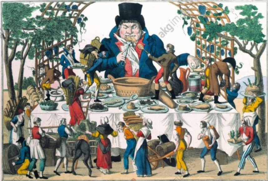
GARGANTUA A SON GRAND COUVERT.

À Paris chez David, M. L'Émancipé, rue d'Anjou au coin de celle des Mathurins, N° 44.